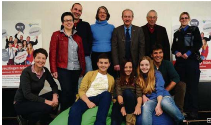
Gemeinsam stark: Verschiedenste Kreuzlingerinnen und Kreuzlinger setzten sich für das Pilotprojekt ein und werben für den Workshop.

KREUZLINGEN. Respekt, Mut und Zivilcourage: In Kreuzlingen soll sich im öffentlichen Raum sicher fühlen. Am Workshop «Kreuzlingen zeigt Stärke» am 12. März wird die Bevölkerung definieren, wie sie sich das Zusammenleben vorstellt.